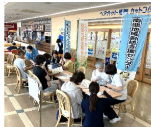
▲健活チャレンジの様子

地域の方向けに介護予防になる体操講座や認知症予防の講座、健康イベント（健活チャレンジ）などを開催しています。自宅で介護をしている方向けの講座「家族介護者教室」も実施しています。開催のお知らせは岡崎市の広報に掲載しています。