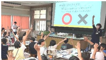
▲羽根小学校での講座の様子