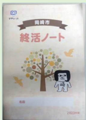
▲使用した「終活ノート」

羽根学区戸崎長生会の老人クラブでは、年に1回美合の高年者センター岡崎に老人クラブの会員が集まり、座談会やカラオケ大会を行っています。毎年代表者より出前講座の依頼があり、今年度は、4月19日（金）に「今を楽しむための終活」というテーマで約1時間の講義を行いました。岡崎市が発行している「終活ノート」を用い、実際にノートに記入する時間を設けながら講義を進行しました。家族・親族へのメッセージを記入する時間では、参加者同士で宛先や内容を悩みながら真剣に自分の思いを終活ノートに書かれています。